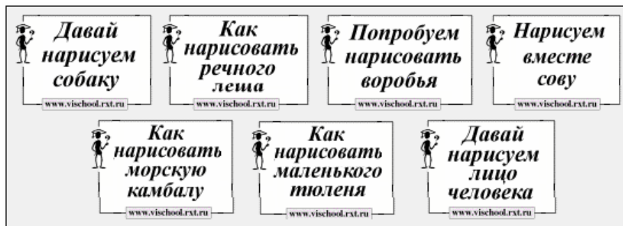
Рис. 5.01. Титулы слайд-фильмов серии «Смотрим, рисуем и называем»

Изображения животных в данной серии специально “настроены”: