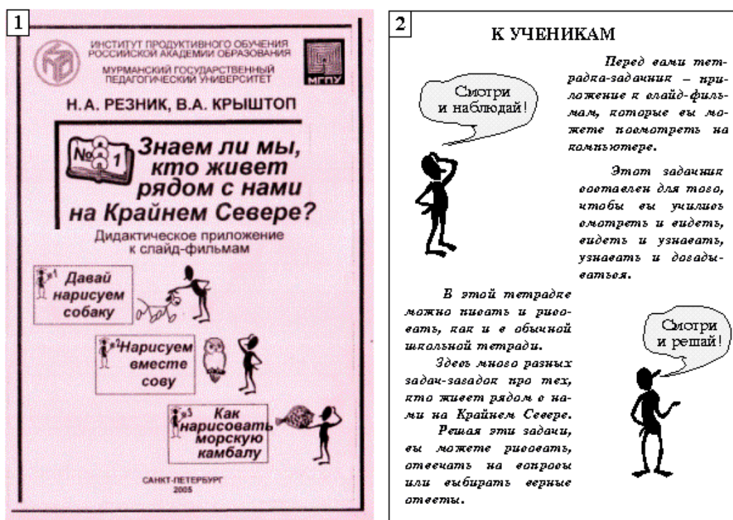
Рис. 5.03. Титул (1) и “инструкция” для учеников (2) в первом издании дидактического приложения к слайд-фильмам серии « Смотрим, рисуем и называем »

После исправлений и доработок (с позиций научности) эти листы были соединены в маленький визуальный задачник (14 страниц и три персонажа) со страницами размера А5 с наименованием « Знаем ли мы, кто живёт рядом с нами на Крайнем Севере? » (рис. 5.03).