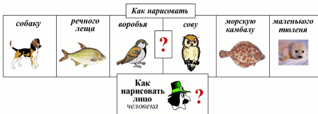
Рис. 5.02. Герои слайд-фильмов серии «Смотрим, рисуем и называем» коллекции «Знаем ли мы тех, кто живёт рядом с нами?»

В своё время (2004 год), испытав положительные эмоции от общения с детьми в период первых апробаций отдельных слайд-фильмов этой серии (запись пленки с их голосами прослушивалась нами неоднократно), мы решили закрепить наш успехи и разработали специальные дидактические материалы.